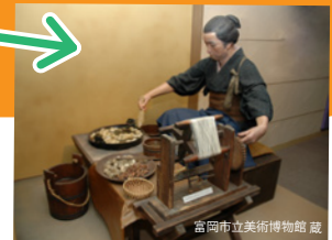
富岡市立美術館蔵

にせもの偽物を買ったり、量を多く見せたりして売る 悪い商人 が出てきて外国からも信用を失っているようだ。