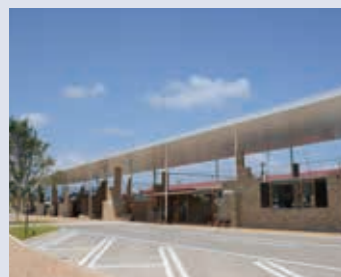
2014年度グッドデザイン賞受賞

富岡製糸場の最寄り駅として、駅舎の建替が行われる運びとなり、2014年3月に3代目として生まれ変わりました。