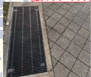
細かいグレーチング