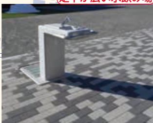
足下が広い水飲み場