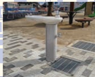
足下が広い水飲み場