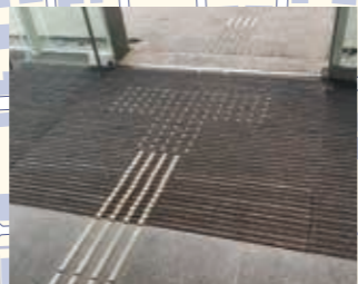
マットと一体型の点字