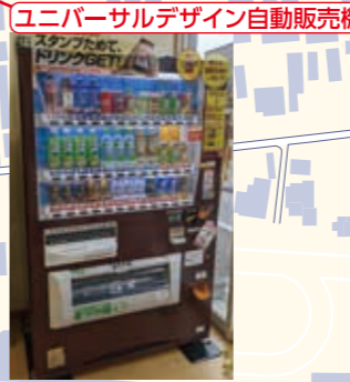
ユニバーサルデザイン自動販売機