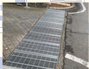
細かいグレーチング