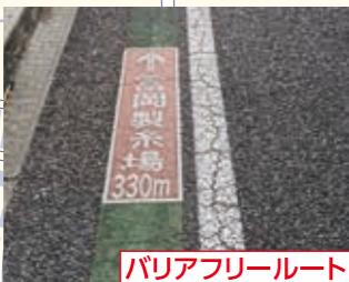
バリアフリールート