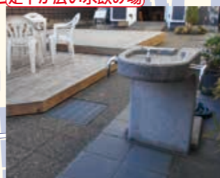
足下が広い水飲み場