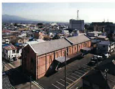
旧安田銀行担保倉庫 (前橋)