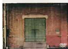
ドキュメンタリーDVD 制作：上州文化ラボ