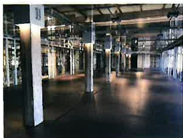
西置繭所多目的ホール